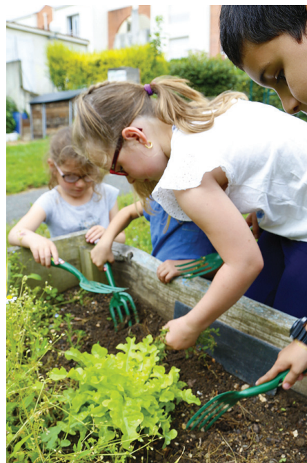
▲ Autour du potager du Clos Saint-Julien.

www.ville-bouguenais.fr/enfance-jeunesse/projets-educatifs