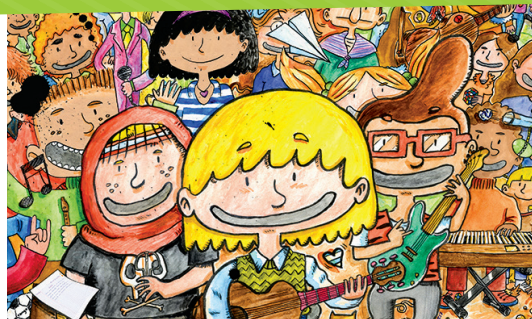
▲ Le dernier jour de Monsieur Lune , mercredi 20 décembre au Piano'cktail.