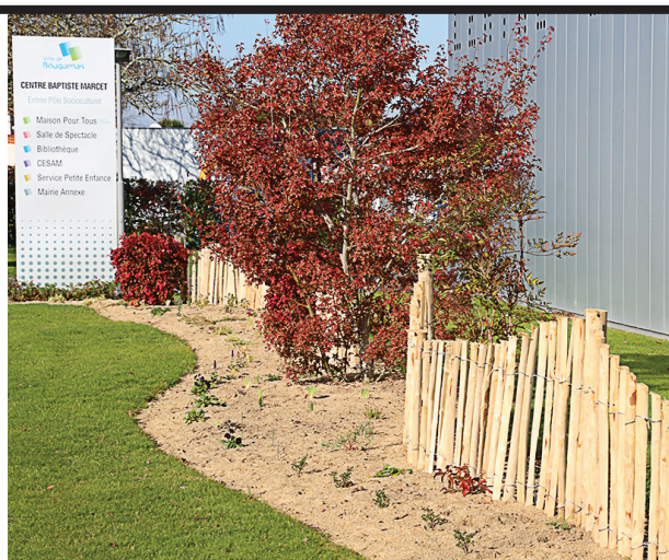
▲ Massifs et ganivelles agrémentent joliment les abords du centre Marcet.

Signaler un problème sur la voie publique, consulter la circulation en temps réel, savoir quand arrive mon prochain bus ou tram ? Quels sont l'adresse et les horaires de la piscine ou d'un autre équipement public ? Reste-t-il de la place au parking ?... A Bouguenais, comme dans le reste de l'agglomération, Nantes dans ma poche répond aux préoccupations du quotidien par des services personnalisables et actualisés en temps quasi-réel. Disponible gratuitement, l'application complète un ensemble d'outils numériques dédiés à la mobilité et à la vie quotidienne parmi lesquels www.ville-bouguenais.fr