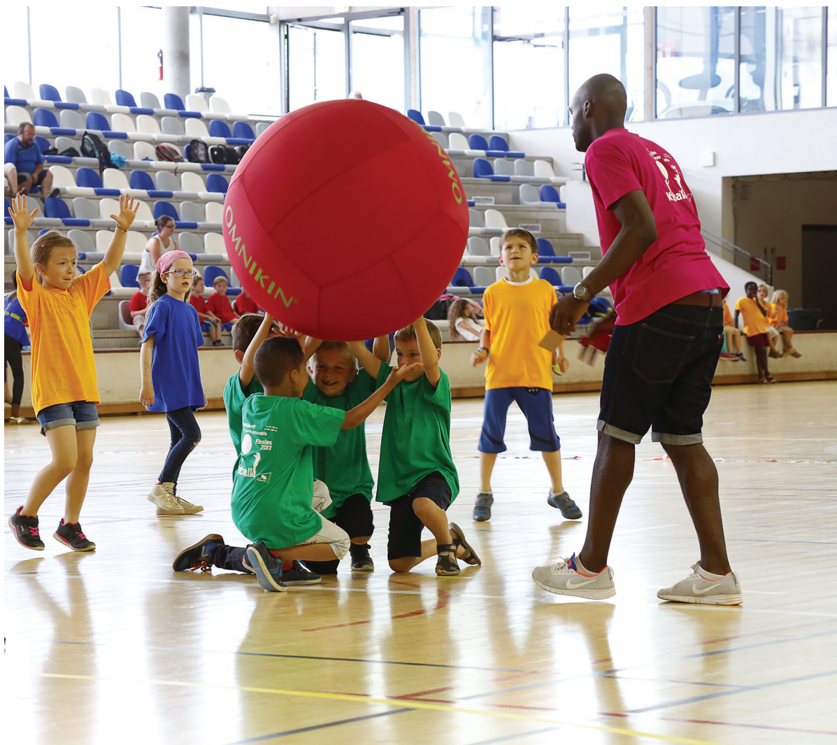
Tournoi sportif inter espaces éducatifs. ▲