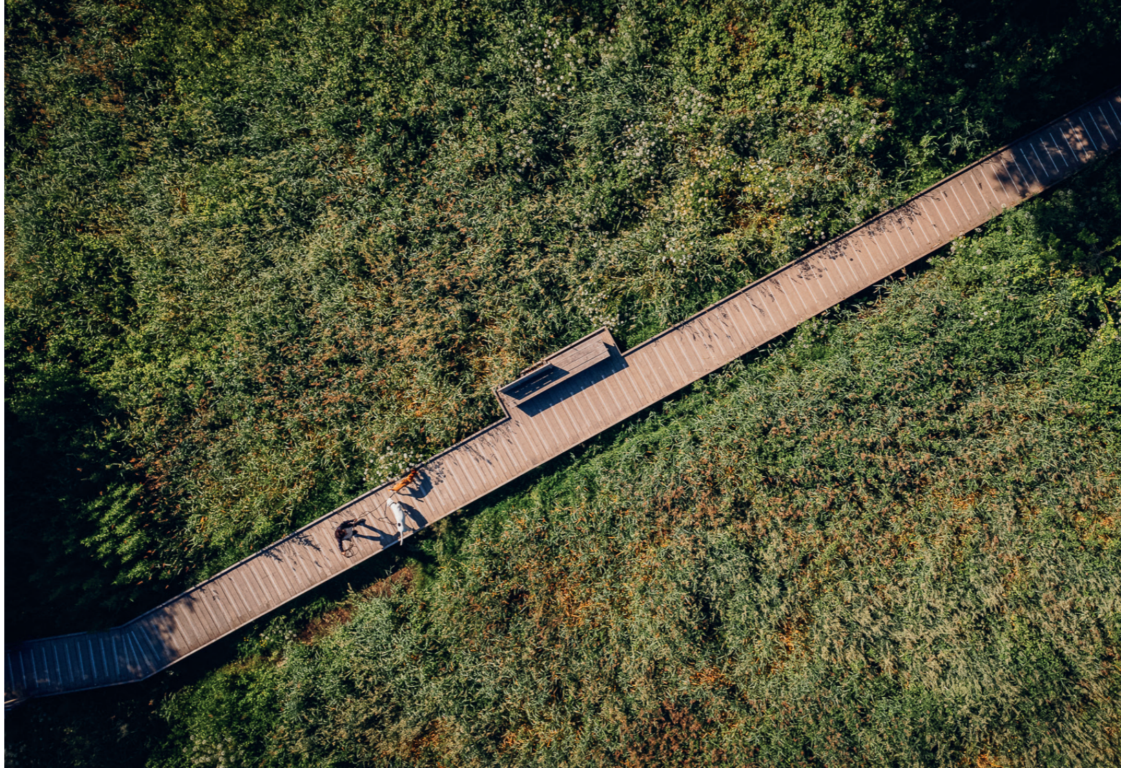
Vue aérienne du Tour des Couëts.