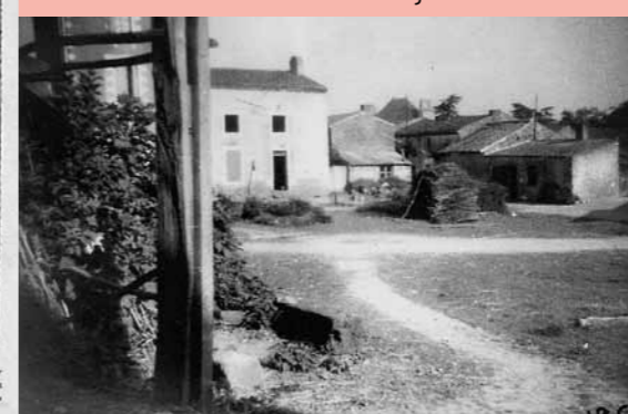
La place du Bois Chabot en 1950.