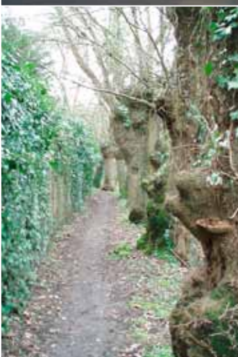
Le chemin des «Bonnes sœurs».