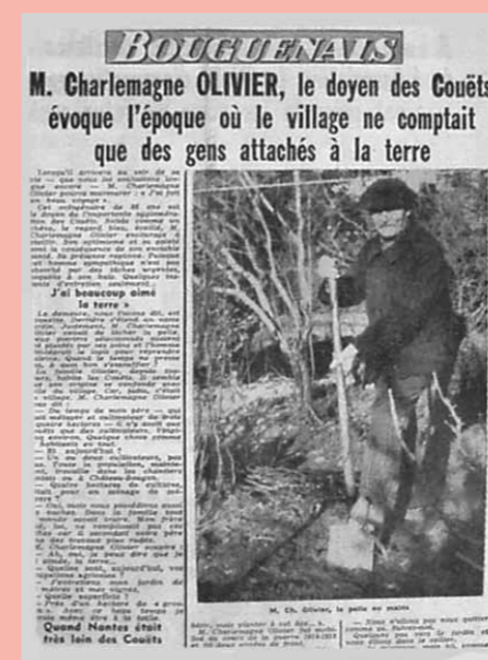
Quest-France du 16 février 1961.

• Après la guerre, 3 jeunes sont allés à la recherche d'un obus pour récupérer de la poudre. L'obus a éclaté, faisant un mort et un blessé qui a dû être amputé d'un bras et d'une jambe, le 3ème s'en est tiré avec des égratignures.