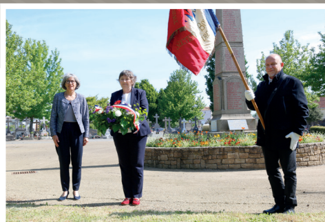
▲ Cérémonie du 8 Mai 1945 - Au cours d'une cérémonie à huis-clos, le Maire, la conseillère départementale et un porte-drapeau ont déposé une gerbe au Monument aux Morts et au carré militaire.