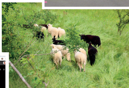
▲ Eco-pâturage - Les moutons de Terre et Bêe ont été déconfinés et pâturent de nouveau sur les bassins d'orage de la Pierre Blanche et de la Croix-Jeannette.