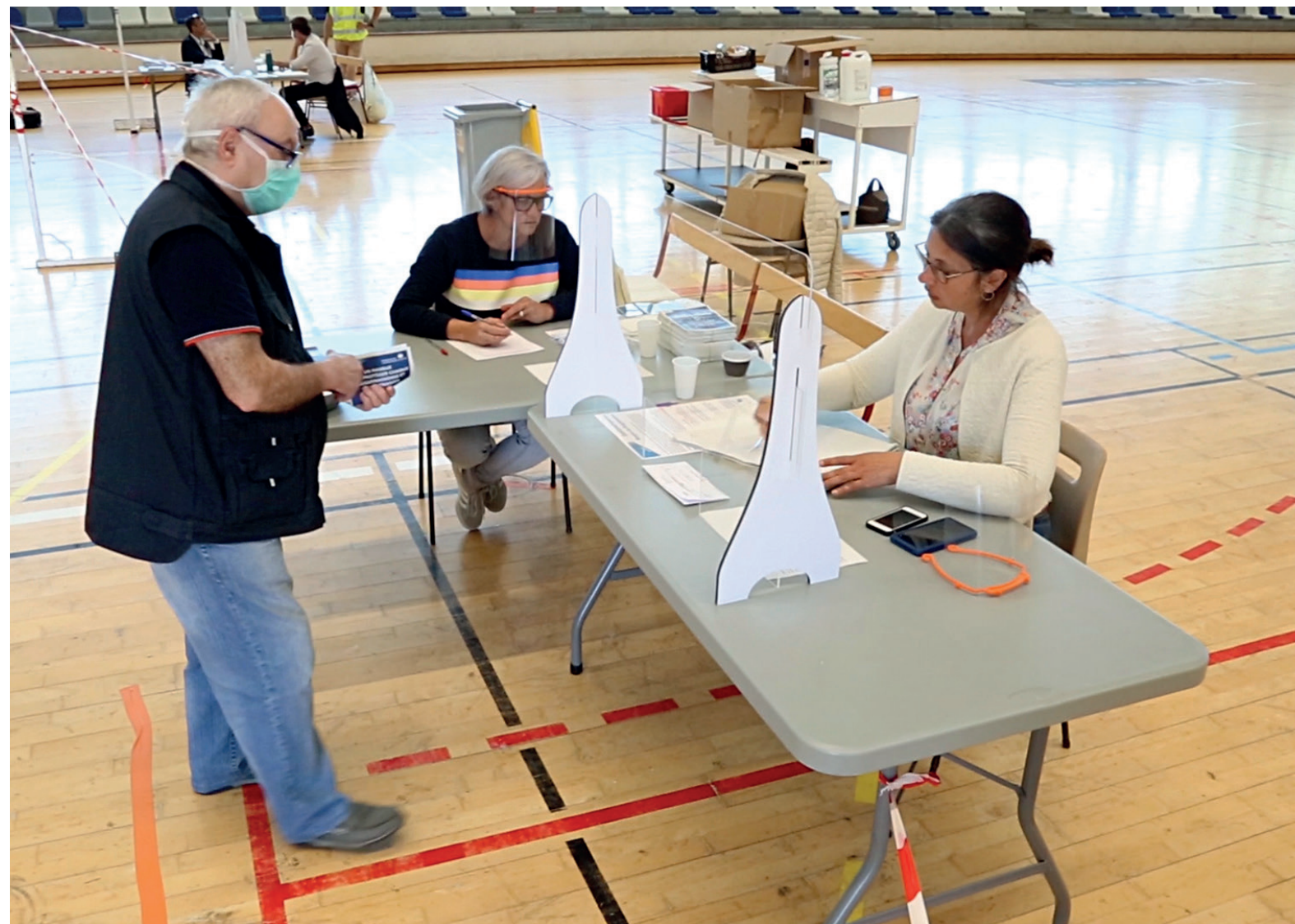
▲ Distribution de masques aux habitants le mardi 19 mai 2020.

municipaux, dont plus de 200 agents étaient en télétravail, s'organisent différemment avec pour certains agents une reprise de leur fonction physiquement (par exemple agents des Espaces