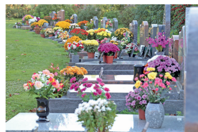
▲ Cimetières - Ils ont réouvert le 11 mai dans le respect des gestes barrières et de la distanciation sociale.