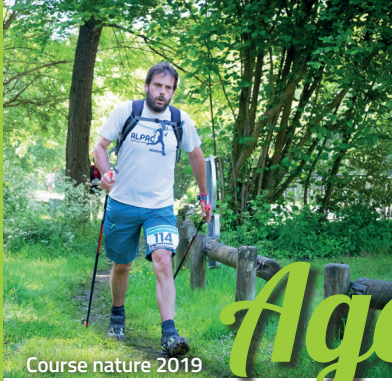
Course nature 2019