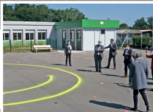
◀ Collège La Neustrie - Recteur d'Académie, représentants du Conseil départemental et de la Mairie constatent la réorganisation de l'établissement en raison de la crise sanitaire pour accueillir le retour d'une partie des élèves le 18 mai.